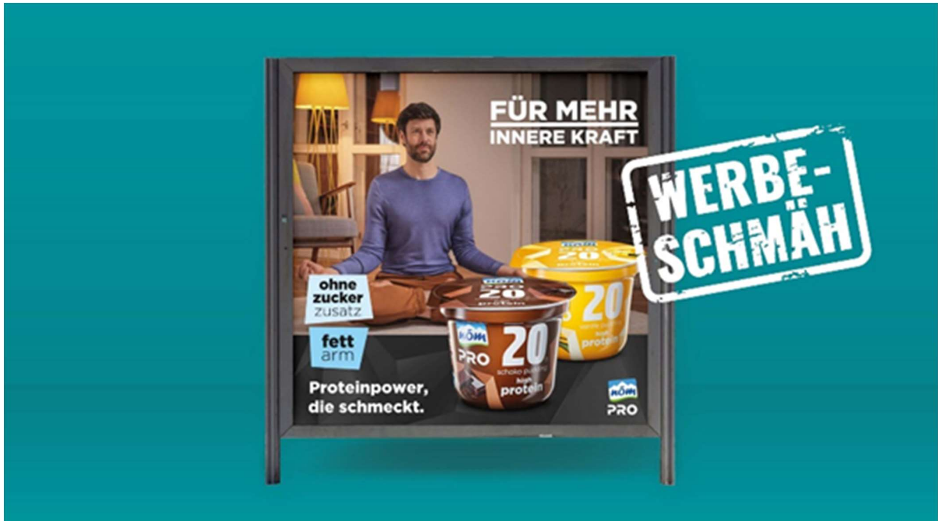
Werbeschmäh März 2023 Talas/foodwatch