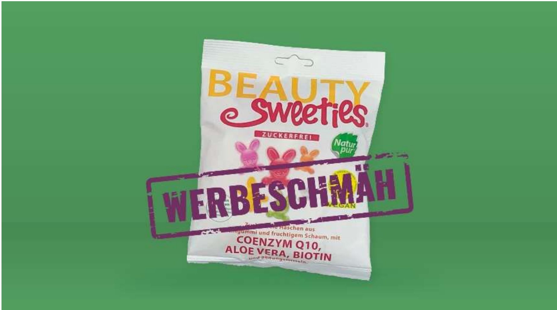
Werbeschmäh Juli 2022 Talasz/foodwatch