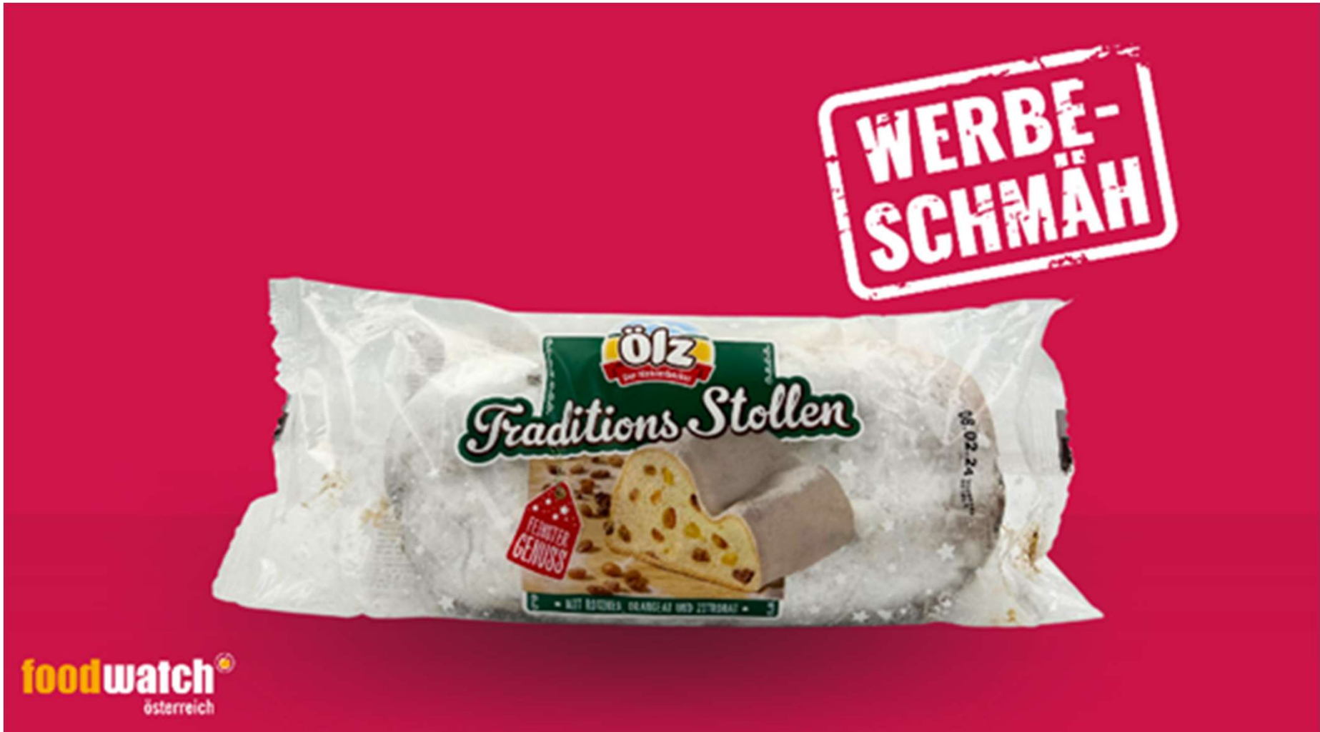
Werbeschmä November 2023 Talas/foodwatch