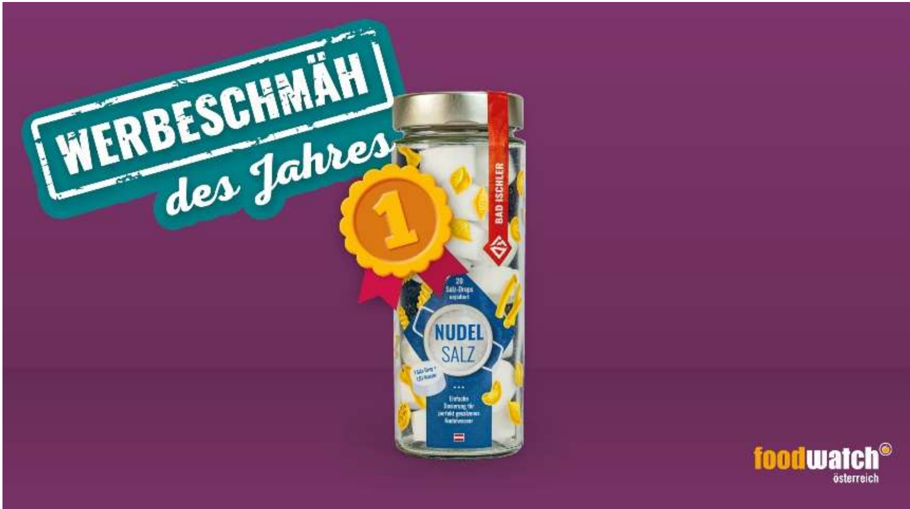
Werbeschmäh des Jahres 2023